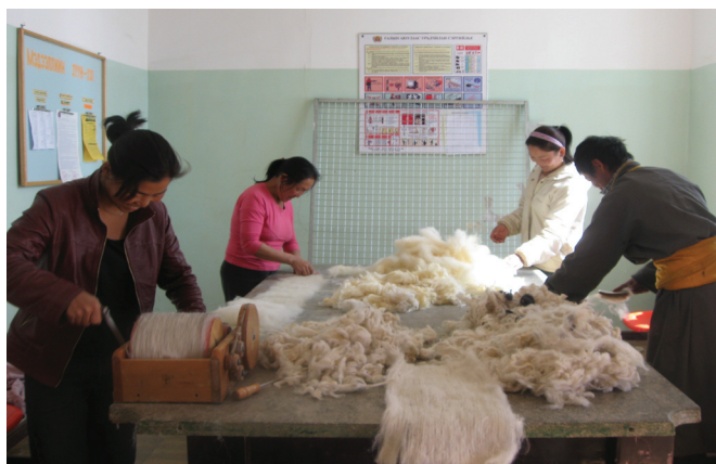
Эх үүсвэр: НҮБХХ-ийн Цөлжилтийг бууруулах газрын тогтвортой менежмент төсөл

Санхүүжилт: 100,000 ам. доллар Үр шимийг хүртээгч: Онцгой байдлын ерөнхий газар Хугацаа: 2010 оны 4 сарын 1-ээс 10 сарын 1 хүртэл, зургаан сар